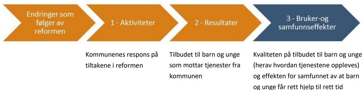
Figur 4-1 Eksempel på overordnet årsak-virkningskjede for barnevernsreformen (basert på SSØ, 2010)

Som vi utdyper nærmere i Pedersen mfl. (2022) og Kjelsaas mfl. (2023), er det naturlig at de fleste indikatorene knytter seg til aktiviteter og resultater, spesielt de første årene etter ikrafttredelse av reformen. Jo lenger ut i resultatkjeden vi kommer, jo vanskeligere er det å finne gode målbare kvantitative indikatorer samt å sannsynliggjøre at observerte effekter skyldes en gitt endring. Samtidig er det bruker- og samfunnseffekter som har mest å si over tid, og som knytter seg mer direkte til målene med reformen.